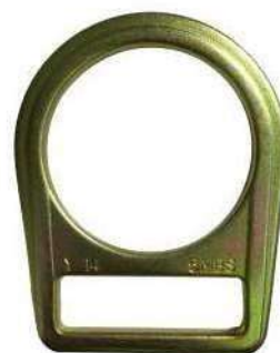
Argolla en acero Galvanizada Resistencia mínima a la tensión 23kN